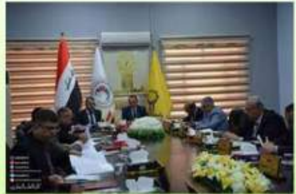
حضور السيد عميد الكلية الاجتماع السابع للجنة عمداء كليات الطب البيطري