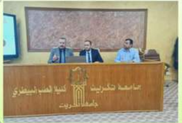
مناقشة عناوين رسائل طلبة الدراسات العليا