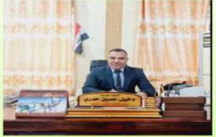
معاون العميد للشؤون العلمية