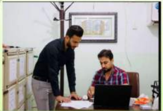
التهيئة لاستقبال وتسجيل الطلبة المقبولين في كلية الطب البيطري