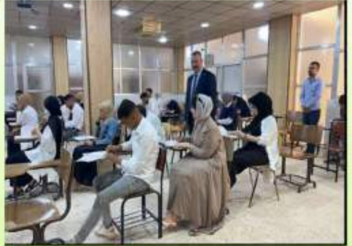
الامتحانات النهائية/ كلية الطب البيطري