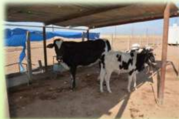
حقل تربية الابقار / كلية الطب البيطري