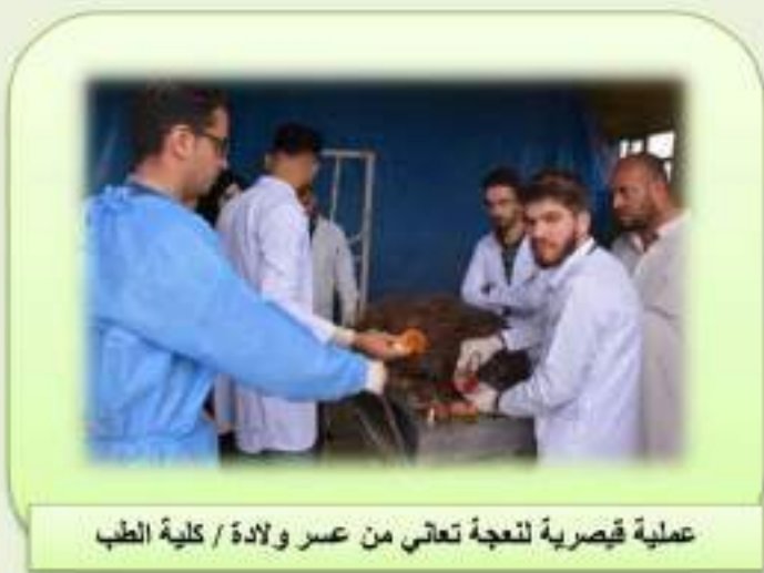
عملية قيصرية لنعجة تعاني من عسر ولادة / كلية الطب