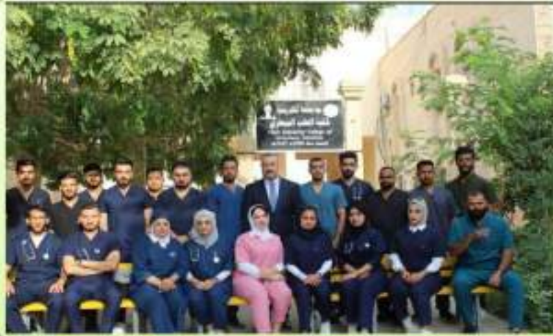
طلاب المرحلة الخامسة مع السيد العميد