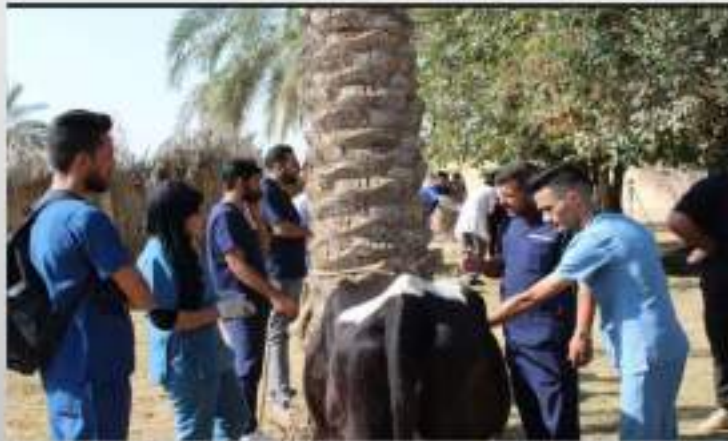
التعاون المشترك بين كلية الطب البيطري والمناطق المجاورة