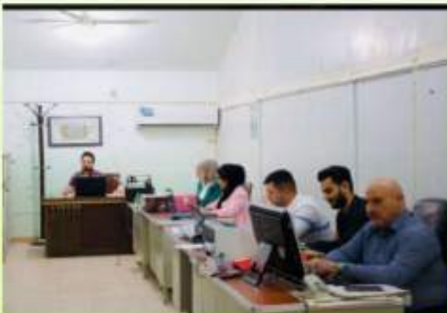
استقبال وتسجيل الطلبة المقبولين في كلية الطب البيطري