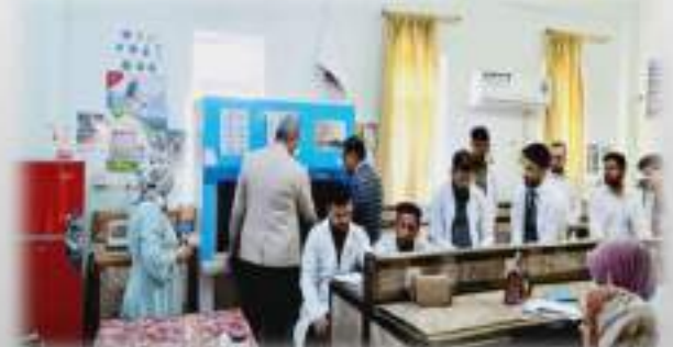
مختبر فرع الاحياء المجهرية