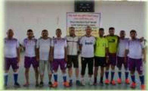
مشاركة الاساتيد في دوري الكرة الخماسي للصالات