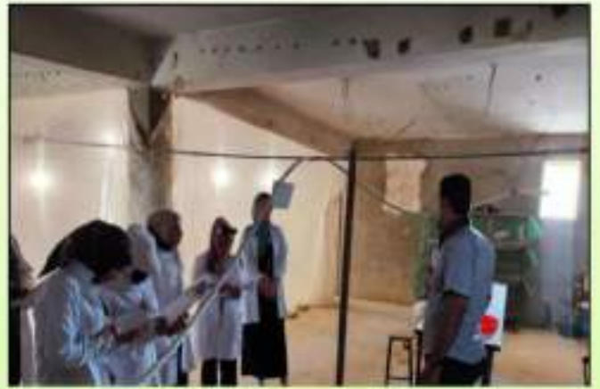
زيارة ميدانية لطلبة المرحلة الاولى الى حقول كلية الزراعة