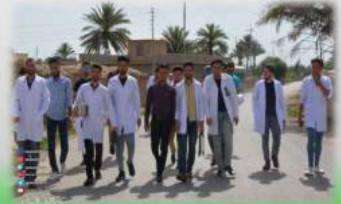
التعاون المشترك بين كلية الطب البيطري والمناطق المجاورة