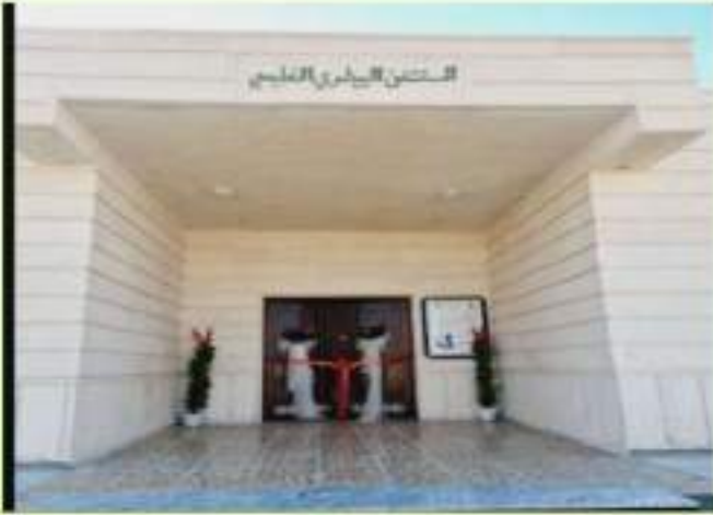
المستشفى البيطري التعليمي الجامعي في كليتنا