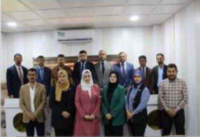
فرع الصحة العامة