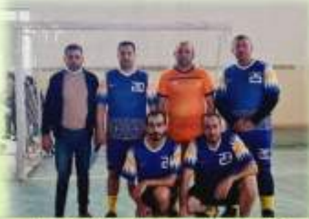
مشاركة الاساتيد في دوري الكرة الخماسي للصالات