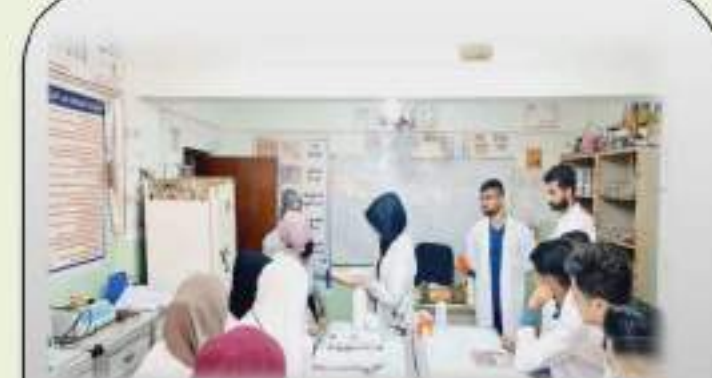
مختبر الكيمياء العامة