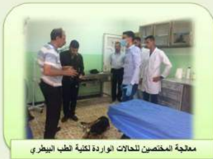
معالجة المختصين للحالات الواردة لكلية الطب البيطري