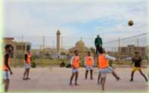
مشاركة الطلبة في دوري كرة الطائرة

تشارك كلية الطب البيطري بأساتذتها وطلبتها في كافة النشاطات اللاصفية المقامة في الجامعة ، حيث تعمل الأنشطة على تعزيز التواصل وترسيخ قيم المجتمع الجامعي في ذهن الطالب ، ومن جهة أخرى تعمل على صقل مواهب الطلبة وتعزيز مهاراتهم ومواهبهم.