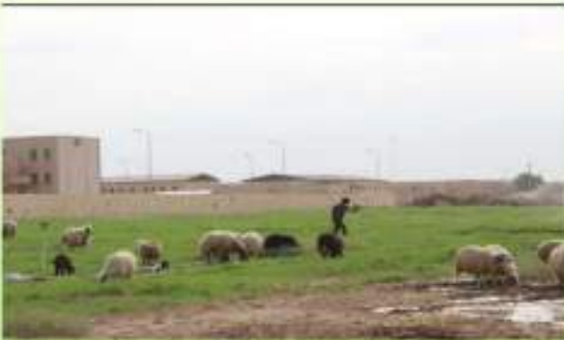
حقول كلية الطب البيطري

يبلغ عدد الطلبة في جميع المراحل الدراسية في الوقت الحاضر أكثر من 200 طالباً وطالبة، أما عدد تدريسي الكلية فيبلغ 54 تدريسياً وتدرسية بمختلف الاختصاصات والألقاب، فاستطاعت الكلية بهذا الكادر تخريج أربعة عشرة دورة، حصل خلالها الطلبة على شهادة البكالوريوس في الطب والجراحة البيطرية مما يؤهلهم للعمل في المؤسسات المتخصصة بالشؤون البيطرية والزراعية.