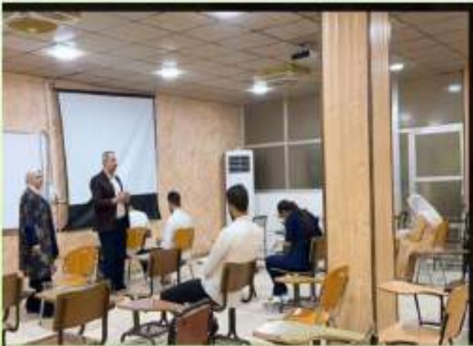
الامتحانات النهائية/ كلية الطب البيطري