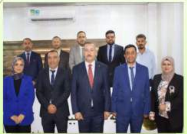
رئيس واعضاء مجلس الكلية