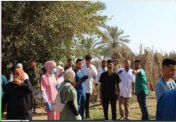
التعاون المشترك بين كلية الطب البيطري والمناطق المجاورة