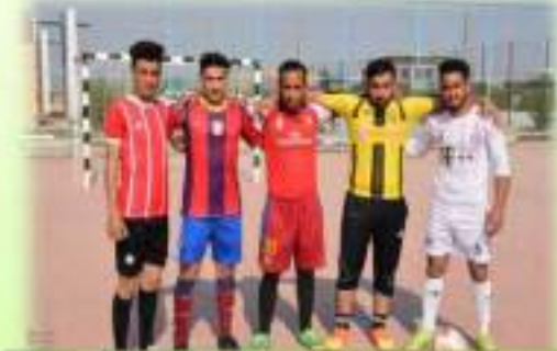
مشاركة الطلبة في دوري الكرة الخماسي