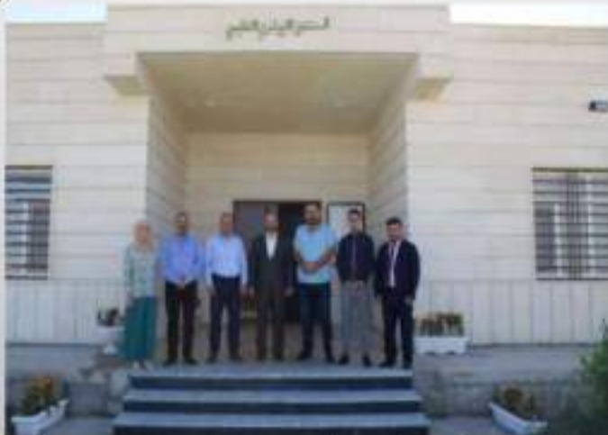
فرع الطب الباطني والجراحة والتوليد

يُعنى بمتابعة علم الأمراض البيطرية والوقوف على مختلف التغيرات المرضية التي تطرأ على جسم الحيوان ومنها الأمراض التي قد تنتقل إلى الإنسان، وأمراض الدواجن وأمراض الأسماك ومادة التشريح المرضي والطب العدلي ومادة السلوك المهني لطلبة المرحلتين الرابعة والخامسة. عدد التدريسيين سبعة.