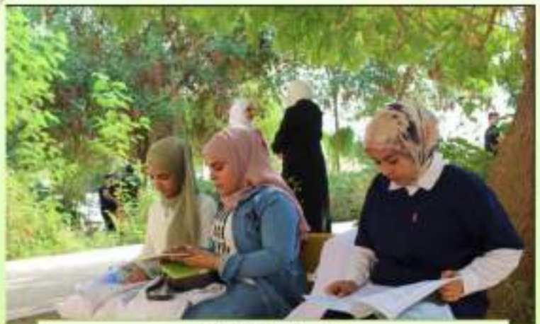
طلاب المرحلة الثالثة