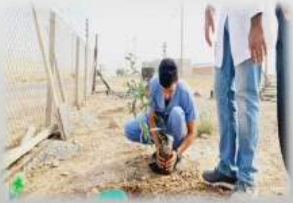
مشاركة الطلاب في خدمة المجتمع