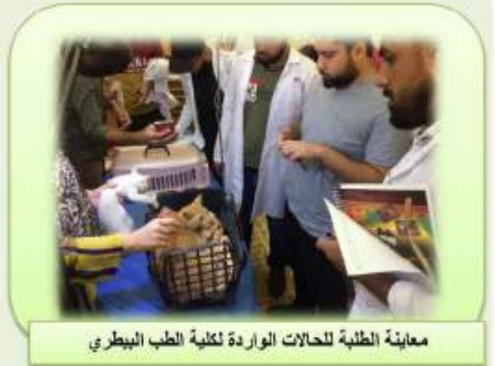
معاينة الطلبة للحالات الواردة لكلية الطب البيطري