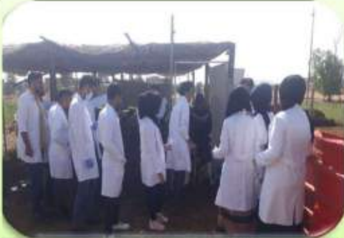
حملة تطعيم الحيوانات في البيت الحيواني