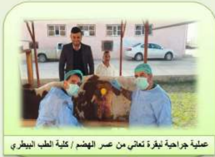
عملية جراحية لبقرة تعاني من عسر الهضم / كلية الطب البيطري