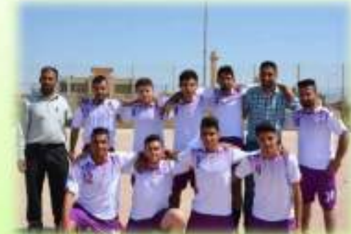
مشاركة الطلبة في دوري الكرة الخماسي