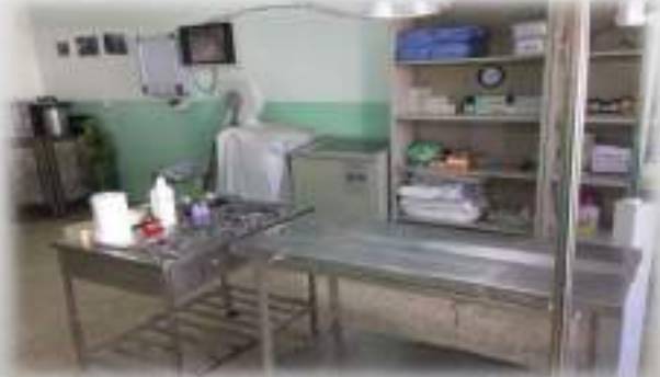
مختبر الجراحة والتوليد