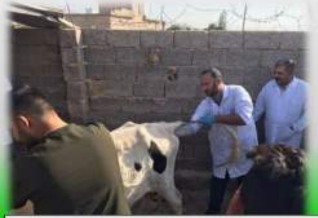
الحملة التطوعية التعاونية لكلية الطب البيطري - قرية المحزم