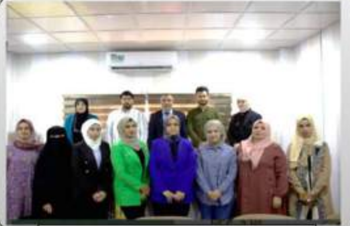
فرع الفلسفة والأدوية والكيمياء الحياتية

يُعنى بعلم إدارة الحيوان والحاسوب وإدارة الدواجن والتغذية والوراثة والإحصاء والصحة العامة البيطرية، ويعمل الكادر التدريسي مع جميع الفروع الأخرى على تدريس وتأهيل الطلبة ليكونوا مؤهلين لحمل شهادة البكالوريوس في الطب والجراحة البيطرية لضمان صحة الحيوان. يبلغ عدد التدريسيين تسعة.