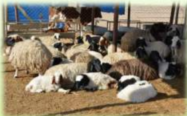
حقل تربية الاغنام / كلية الطب البيطري