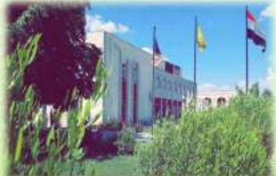
عمادة كلية الطب البيطري