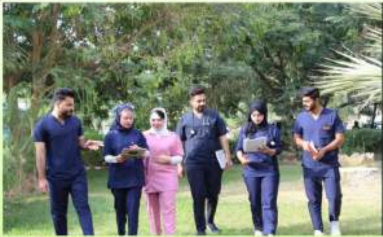
طلاب المرحلة الخامسة في حدائق الكلية