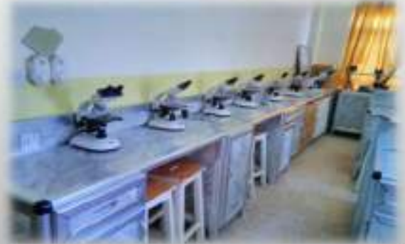
مختبر الانسجة والامراض