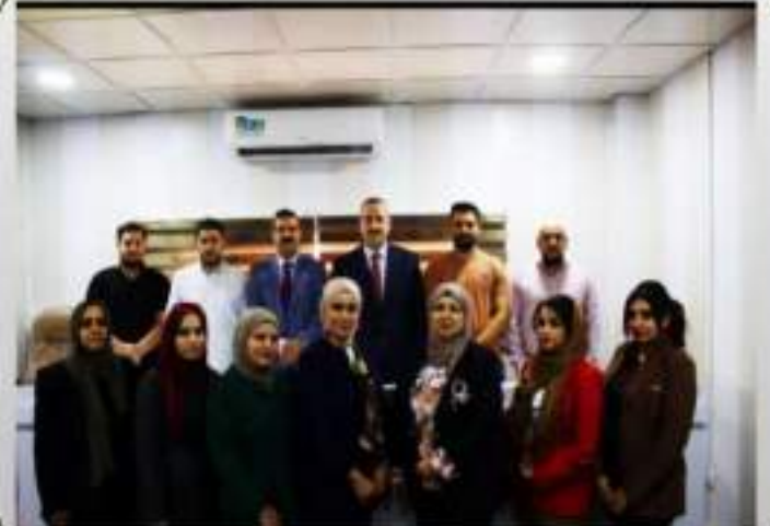
فرع الاحياء المجهرية