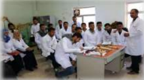
مختبر فرع التشريح