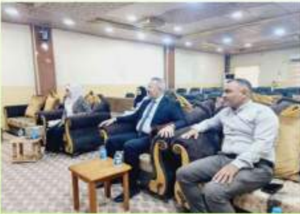
مناقشة عناوين رسائل طلبة الدراسات العليا