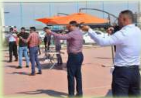
مشاركة الاساتيد في مسابقة الرماية