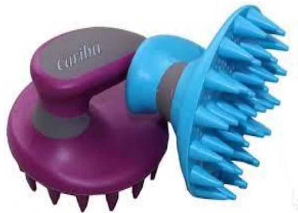
٨- منظم الحافر