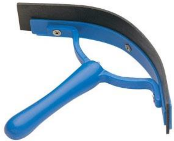
١٠- قطع الاسفنج