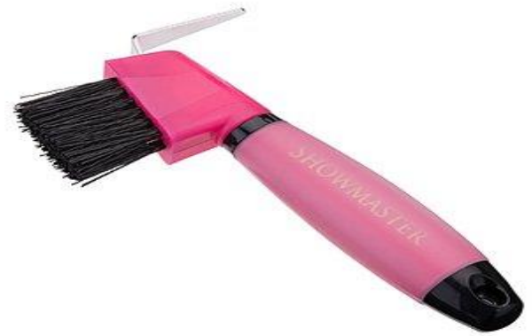
٩- مزيل للعرق